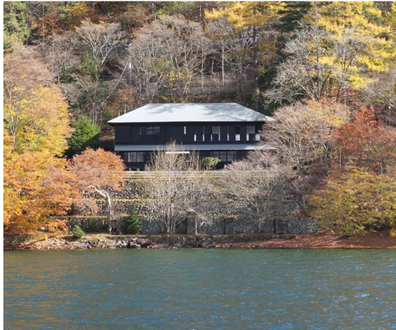
「英国大使館別荘記念公園」

英国外交官として幕末から明治にかけて活躍したアーネスト・サトウが、明治29年(1896)築。明治末期には、30ヶ国の別荘があり、英国は最も古い。木造2階建て、述べ床面積は約4000㎡。外観は和風建築だが、室内には暖炉などがある。現在湖畔に建つ4つの外国大使館別荘(記念公園含む)の中で最も眺望がよいとされ、2階からは有名な8丁出島が眼前に広がります。英国大使館通訳だったサトウが、湖畔の家を借りて夏場を過ごした際、現地を気に入り、明治天皇から土地を提供されて別荘を建てたとあります。その後、大使館別荘として使用したようです。サトウは、イギリスの通訳官及び外交官として日本に25年滞在しています。別荘は老朽化が進み、2008年から使われていません。