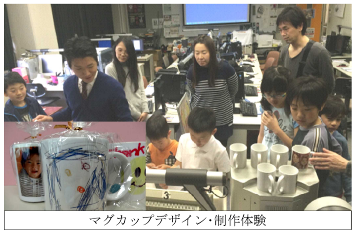
マグカップデザイン・制作体験