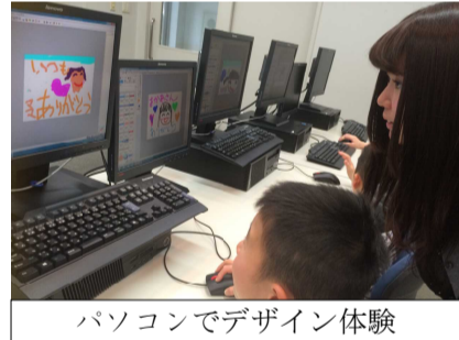
パソコンでデザイン体験

共栄大学発ベンチャー(有)かいしゃ(有)こと海老原研究室が開催した「第11回キッズICTスクール」が無事終了しました。