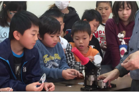
オリジナル缶バッジの作成体験

保護者の方も参加型の「キッズICTスクール」なので、お子様と一緒に参加することにより「キッズICTスクールの授業内容や必要性を肌で感じていただけると思います。